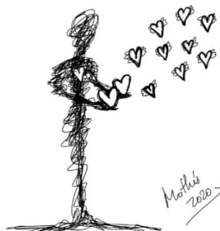
Rabisco 12: Meu coração em suas mãos 2 (Mothú 2020)