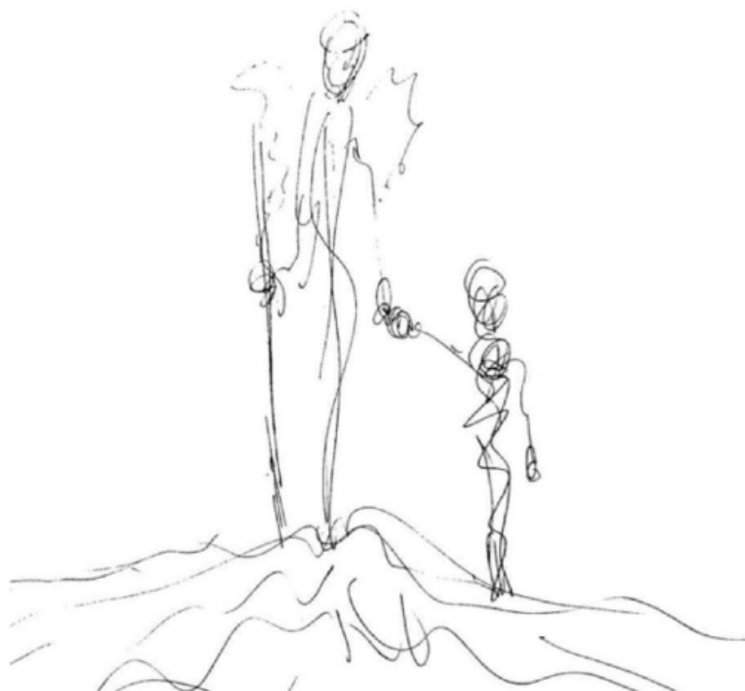
Rabisco 1: Sempre com você (Mothú, 2019)

[Orientações desenvolvidas por profissionais espanhóis especializados em luto e perdas, traduzidas pela equipe Segura a Onda junto à Rede de Apoio às Famílias de Vítimas de Covid aqui no Brasil e à Associação Brasileira de Estudos Cemiteriais (ABEC) ]