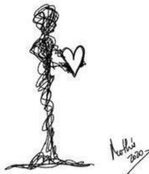
Rabisco 5: Meu coração em suas mãos 1 (Mothú, 2020)

- Faça uma atividade que aprimore sua criatividade artística : desenho, artes-plásticas, música, dança... Isto te ajudará a expressar suas emoções, o manterá entretido, dará sentido ao processo de luto.