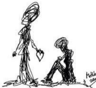
Rabisco 11: Não desista (Mothú 2020)