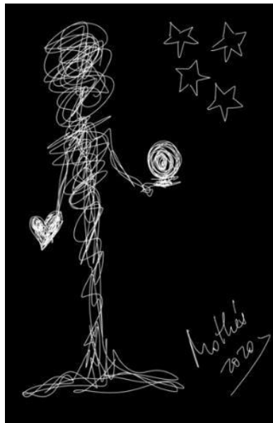
Rabisco 10: Luz (Mothú 2020)