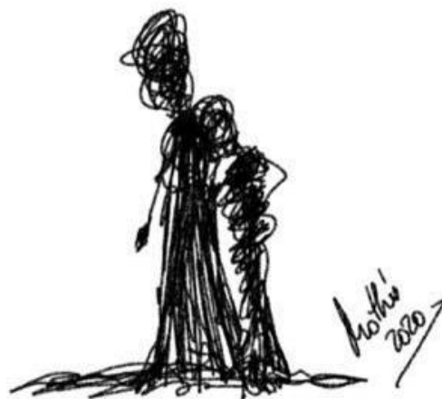
Rabisco 3: Descanse no meu ombro (Mothú 2020)

Da mesma forma, as empresas funerárias e outras empresas ou pessoas especializadas estão oferecendo serviços de aconselhamento e apoio psicológico a seus clientes. Descubra esse serviço, que pode ser de grande ajuda para esses momentos.