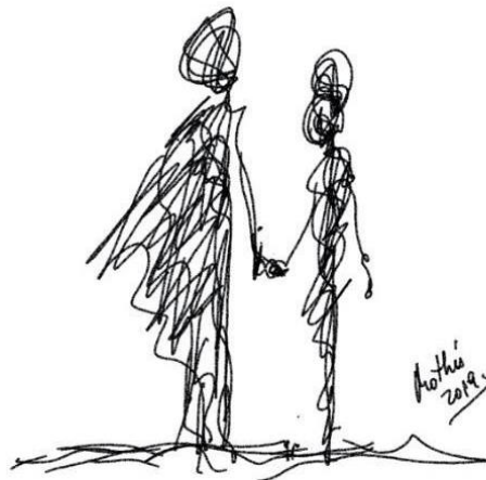
Rabiscos 8: Estou aqui (Mothú 2019)

- Que a nossa atitude em relação à morte durante esses dias seja bonita, embora difícil, de aprendizagem. "Não é o que acontece conosco, mas a atitude que escolhemos ter em relação ao que acontece"