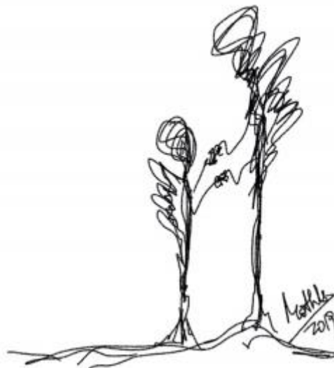
Rabisco 7: Com suas asas (Mothú 2019)