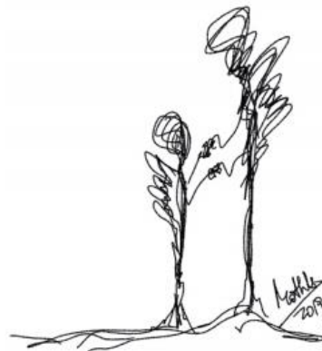
Rabisco 6: Nunca maltrate minha fragilidade (Mothú 2020)

Você pode entrar em contato por telefone e outros meios com os enlutados para expressar a eles que você gostaria de acompanhá-los neste momento. As pessoas em luto raramente tomam a iniciativa de telefonar, tente enviar um WhatsApp para elas vendo sua disponibilidade para falar e se, nos primeiros momentos, a pessoa não sentir vontade e não for receptiva, respeite seu momento.