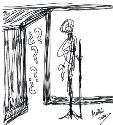
Rabisco 2: Incerteza (Mothú 2020)

Por esse motivo, essa pequena rede espanhola de psicólogos, assistentes sociais, enfermeiros e terapeutas especializados em perda e luto desenvolveu uma série de orientações para ajudá-lo a lidar com esses momentos difíceis de isolamento e incerteza, oferecendo outras maneiras que atendem à necessidade de compartilhar e expressar a dor com os outros e, ao mesmo tempo, permitir honrar a memória de nossos entes queridos falecidos.