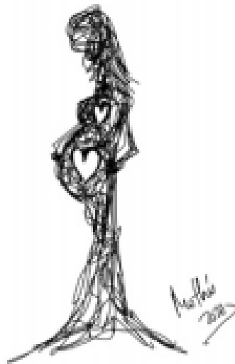
Rabiscos 9: A Espera (Mothú 2012)

Se você estiver grávida ou tiver dado à luz recentemente e tiver sofrido uma perda, poderá se sentir sobrecarregada com a situação, na qual, além disso, você deve proteger e cuidar do seu bebê. Nesses momentos, as emoções podem se intensificar, prolongar e isso pode afetar sua saúde e a da criança; portanto, propomos uma série de estratégias que, embora válidas para todos, podem ser de grande ajuda para seu caso.